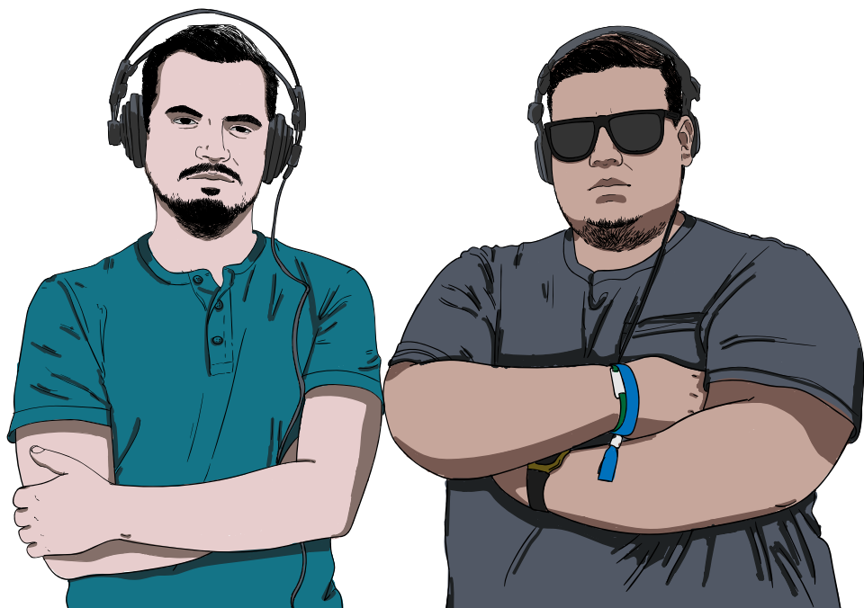
Illusztráció: Nagy Georgina

Emlékezz vissza életed legjobb partijára! Adj még hozzá pár jó zenét! Most egy fantasztikus társaságot! Meg van? Akkor szorozd be tízzel, és voilá: kész az idei felező buli.