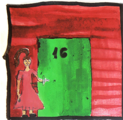
Jól lakott nocsikkal lementünk a szobánkba lepihenni.