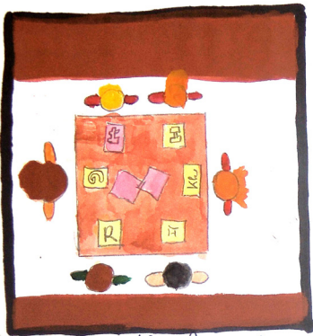
A DUE táborban a tipografikus csoportban a táborozók neki látták a munkáit.