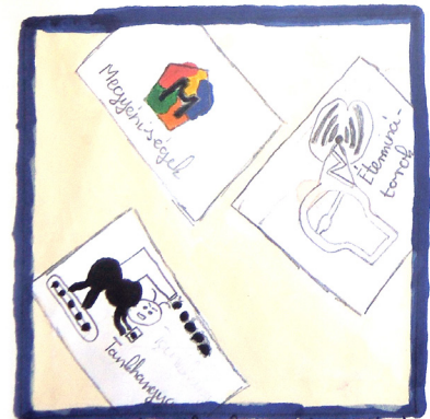
A csapatoktólünk kérték segítséget a logójuk elkészítésénél.