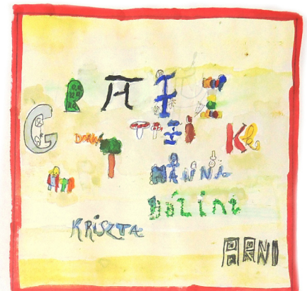
A hitalált csoportneveket betűket szétosztottuk és felragasztottuk egy lapra.