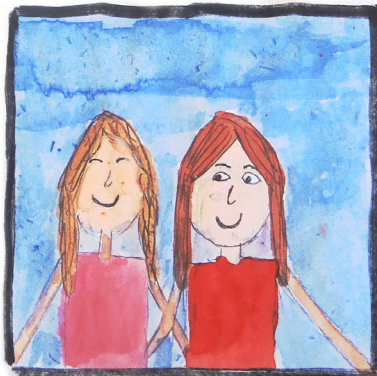
Ez a nap a DUE táborban nagyon tetszett.