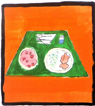
12 30 -kor a munkát félbe hagyva elétekni mentünk.