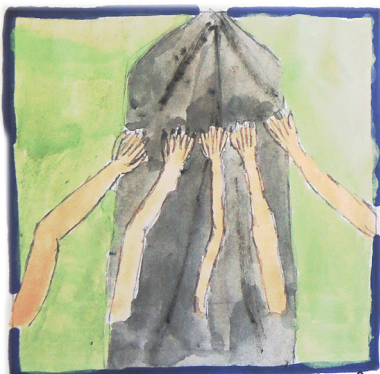
Este egy akadémiai versenyen vettünk részt amiben Egerről tettek fel kérdéseket.