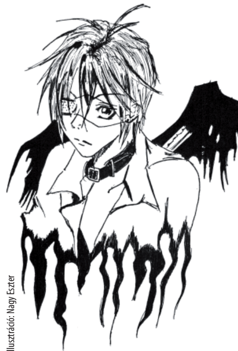
Illusztráció: Nagy Eszter

Évről-évre egyre terjed az anime-fanok száma Magyarországon. Sokan örülnek neki, de vannak, akik kifejezetten utálják.