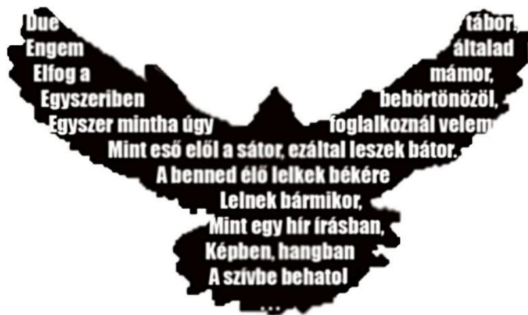
Vers és illusztráció: Pósa Hádizs András