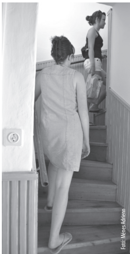
Fotó: Ménes Adrienn