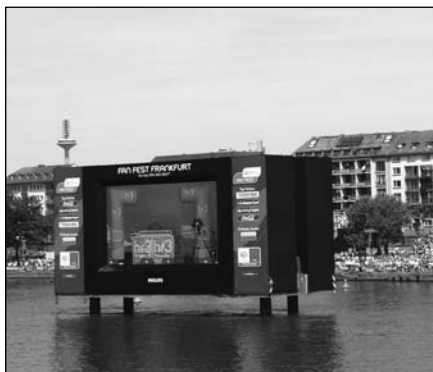
Majna Aréna a vízen. Hullámzó teljesítmény

jártuk a várost: nekem legjobban a Majna Aréna tetszett, mely abból állt, hogy a Majna folyó két szélén volt két óriási tribün, a közepén pedig egy nagy kivetítő. Ez volt a szurkolói