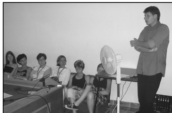
A médiagépezet forog tovább