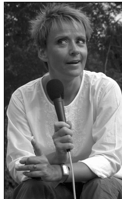
Nem csak mi élveztük a beszélgetést

A tanulási esélyeiket látom nagyon rossznak. Mi-re egy embert megszoknak, egy műsorba beilleszkednek, annak akkorra gyakorlatilag vége van. Egy sikeres műsor ma egy kereskedelmi televízióban maximum 2 évig tart. Egy csatornán csak két, három olyan műsor van, amiből lehet tanulni, ami egy igen szűk keresztmetszet.