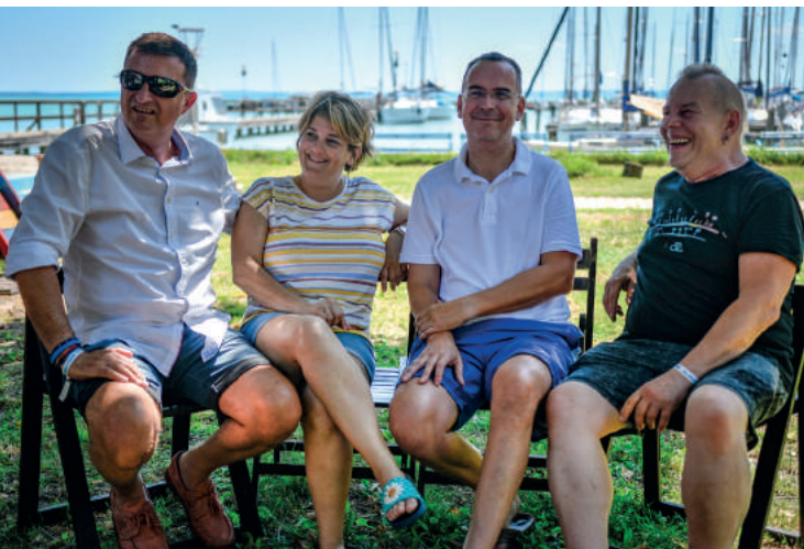
Fotó: Gábor Amarilla Gertrúd, Csurgay Rebeka