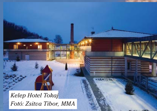
Kelep Hotel Tokaj

„Új hagyományt teremteni a hagyománymentes térben” – mondta Malevics szovjet festő, és utána ezt végre is