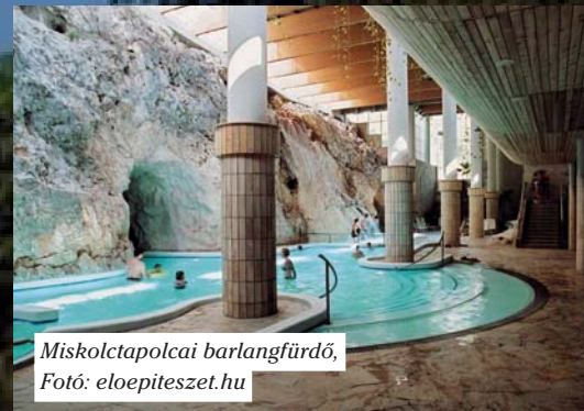
Miskolctapolcai barlangfürdő

Ez a közeggel való harmónia érződik például a Miskolctapolcai Barlangfürdőn is, melynek fejlesztése során építész főtervező volt. Az épület különlegessége a létesítménynek otthont adó, természetes úton kialakult barlangrendszer, illetve maga a Barlangfürdővé kialakított Tavasbarlang, melyet a víz évezredek alatt vájta ki a kemény mészközsiklákból. A fejlesztés során több, eddig még nem használt barlangjáratot vontak be a fürdő területébe, illetve a korábban csónakázásra használt tó egy részét is a komplexumhoz csatolták.