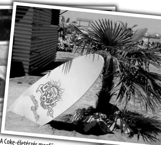
A Coke-életézés megfűszerezte a napunkat