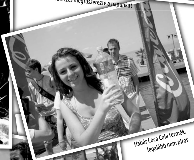
Habár Coca Cola termék, legalább nem piros