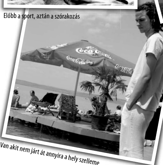
Van akit nem járt át annyira a hely szelleme