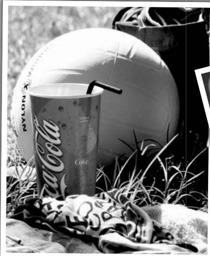
Előbb a sport, aztán a szórakozás