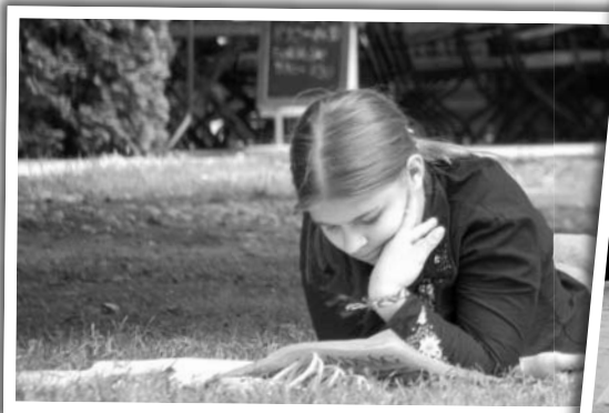
Volt, aki csendben művelődött