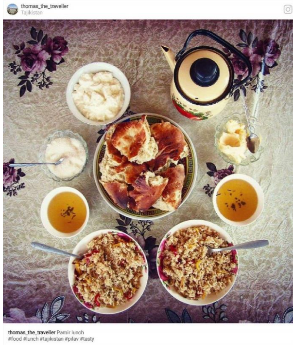
thomas_the_traveller Pamir lunch #food #lunch #tajikistan #pilav #tasty

Rengeteg egzotikus ételt kipróbáltunk már.